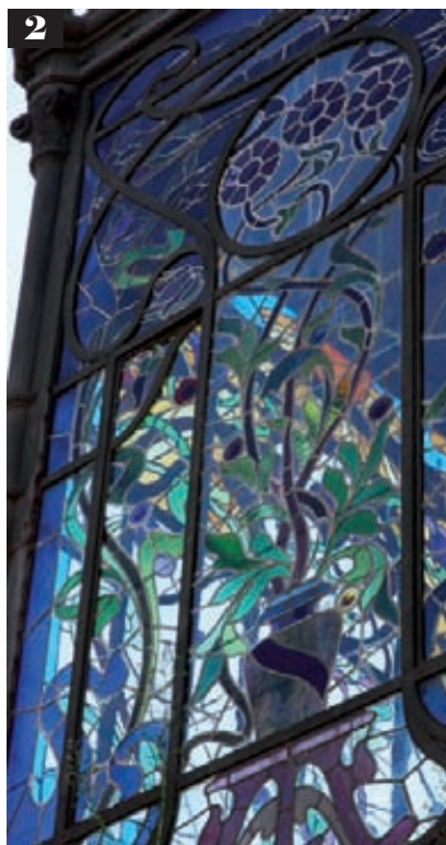
1. Pórtico de la Basílica de Santa María en Vilafranca del Penedès; 2. Edificio Cal Calixtus en Sant Sadurn d'Anoia; 3. Panoràmica de Sitges.